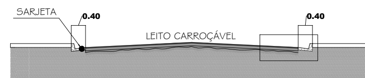
CORTE TRANSVERSAL DA RUA